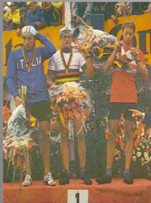
Gerrie Knetteman 1951-2004