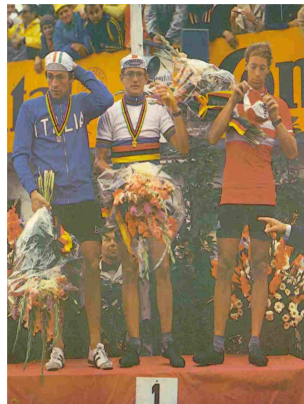
Gerrie Knetteman 1951-2004